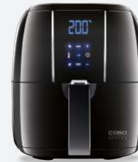
Art.Nr. 3172 AF 200

Griff des Frittierkorbs Handle of frying basket