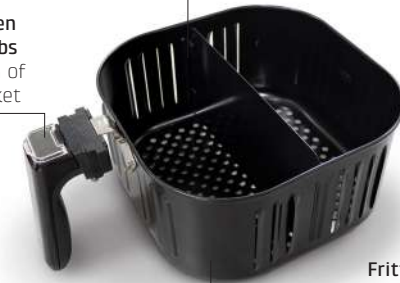
Frittierkorb Frying basket

Hinweis: AF 600 XL ohne Duplex-Trennwand / Note: AF 600 XL without Duplex-divider