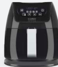
Art.Nr. 3180 AF 250