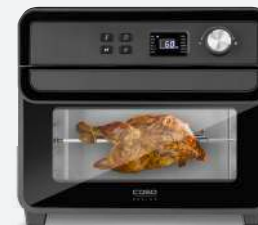
Art.Nr. 3180 Air Fry Chef 1700